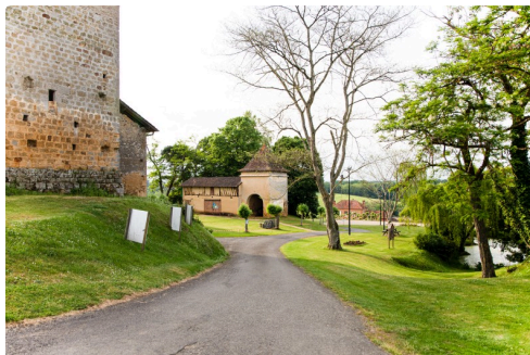
10 Le site du Castet 1bis 120522.jpg