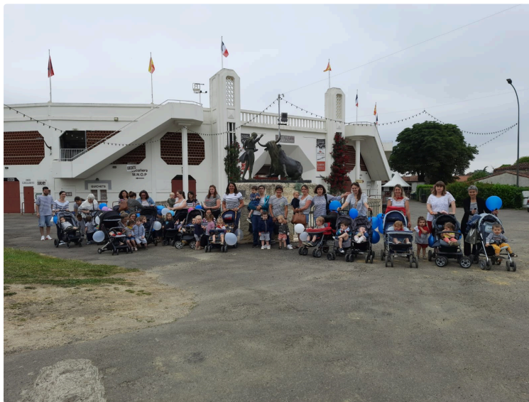
Pentecôtavic, c'est aussi pour les tout-petits !

L'ouverture des fêtes de Pentecôtavic pour les tout-petits est une animation collective qui a été proposée jeudi 2 juin par Le Relais Petite Enfance Cabriole et le Multi-Accueil La Casita .