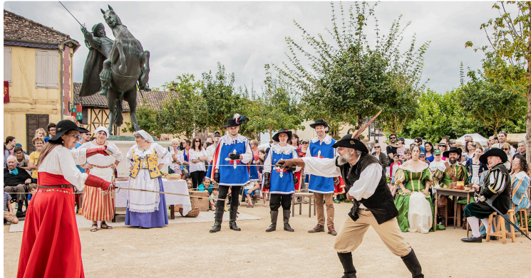
Lupiac prépare le Festival d'Artagnan « Entre Réalité et mythe » 13-14 août 2022

L'association « d'Artagnan chez d'Artagnan » l'organise avec rigueur