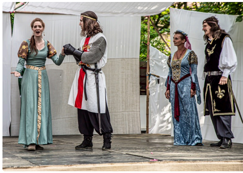
Arthur va épouser Guenièvre (Lames sur Seine en 2019)