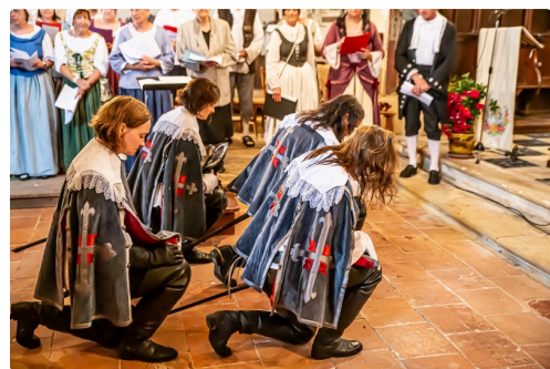
Arrivée de d'Artagnan à la messe en gascon à Lupiac en 2019