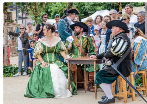
Un duel est imminent (2021)