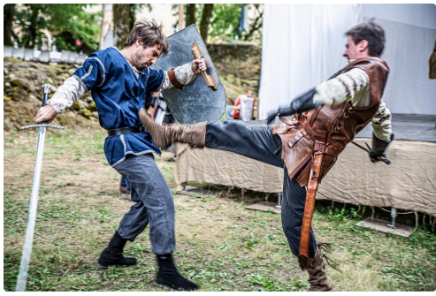
Attaque, parade et suite (Lames sur Seine en 2019)