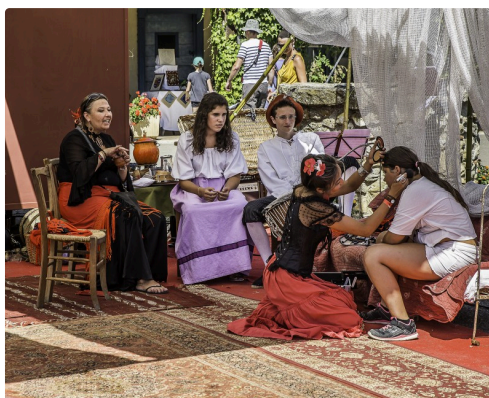
Le campement des bohémiennes en 2016