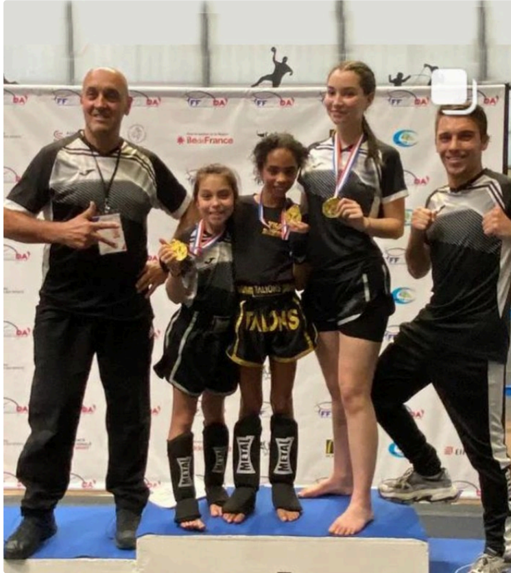
Le Club Boxons sous les feux de la rampe