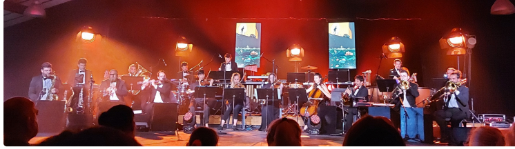
"Les étoiles du cinéma" ont ravi le public vicois

Le public était venu en nombre mercredi soir salle polyvalente pour assister à la première du spectacle de la formation Pink City Orchestra et de la compagnie de danse Les étoiles occitanes, "Les étoiles du cinéma".