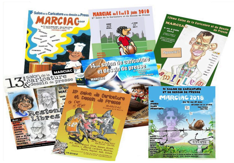
Salon de la caricature : un salon majeur du CLAP

Le 18° Salon de la Caricature et du Dessin de Presse se déroulera sur le week-end de Pentecôte du 3 au 6 juin et en amont dans la semaine précédente pour les scolaires.