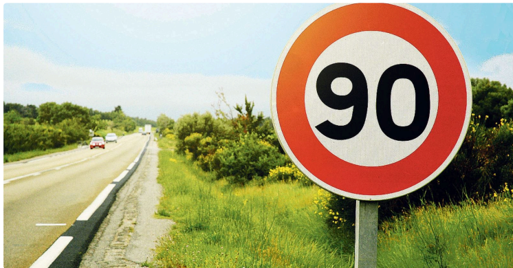
une petite partie du réseau départemental repasse à 90km/h

Routes départementales : 350 kilomètres repassent à 90km/h