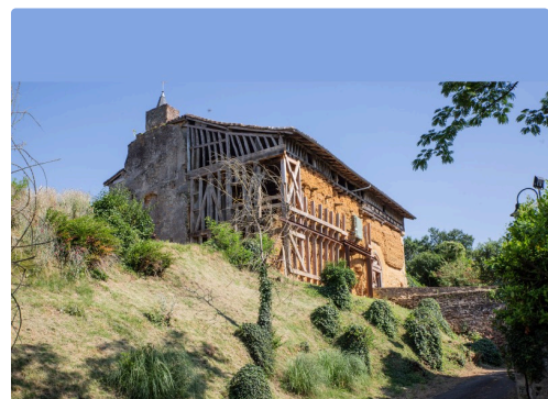
Le Castet vu d'en bas