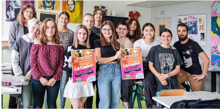
Sainte-Christie-d'Armagnac : mise en valeur insolite du patrimoine par des lycéens

Des animations à la motte castrale, au Castet, à la Manse, à l'église