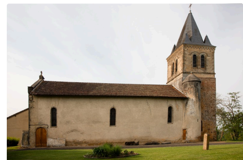
L'église de Sainte-Christie-d'Armagnac