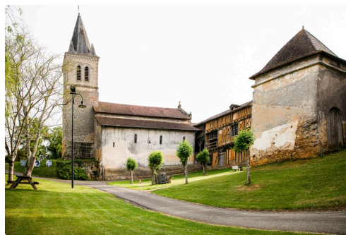
Le site du Castet (église, logis seigneurial et Manse)