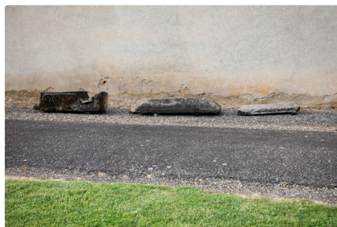
Antiques sarcophages contre le mur de l'église