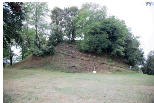
La motte castrale