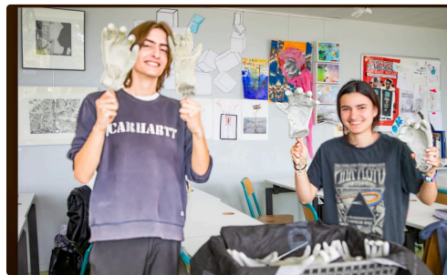
Plein de gants mystérieux pour les sarcophages antiques