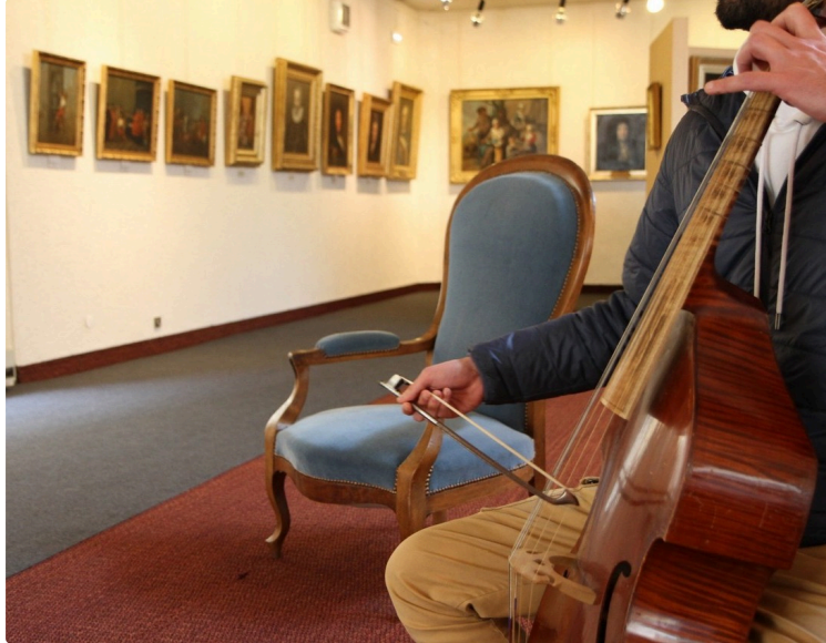
Une animation originale pour la nuit des musées

Visite musicale et historique au Musée des Beaux-Arts de Mirande