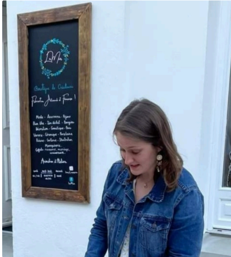
" LuMia " une boutique de créateurs français au coeur du village de Saint-Clar !

Photo : Stacy Desbuisson, lors du vernissage.