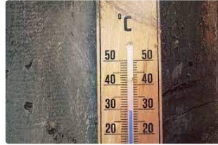
Météo : L'été arrive et vite

Les météorologues sont unanimes : Une vague de chaleur arrivera dès ce lundi en France et particulièrement sur le Sud-Ouest..