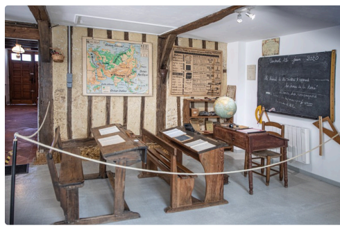
La salle de classe ancienne