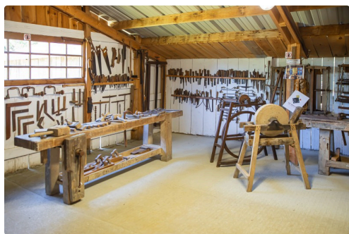
13 Menuiserie 1830 au Musée du paysan gascon 1bis 120620.jpg