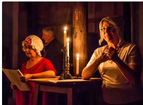
4bis Soirée fête nationale Musée Toujouse 1bis 130716.jpg