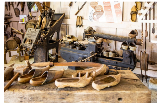
14 Atelier du sabotier au Musée du paysan gascon 1bis 120620.jpg