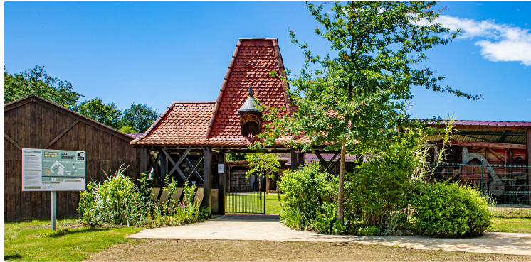
Nuit du Musée du paysan Gascon de Toujouse le 14 mai 2022

Pourquoi ne pas partager un authentique pastis gascon – que d'aucuns appellent « croustade » - le soir du samedi 14 mai 2022 à 20 h 30 au Musée du Paysan Gascon ? À l'occasion de la Nuit européenne des Musées.