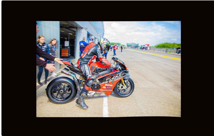
Championnat Superbike au circuit de Nogaro : démarrage

L'affrontement de l'élite de la vitesse en 7 catégories de motos de compétition