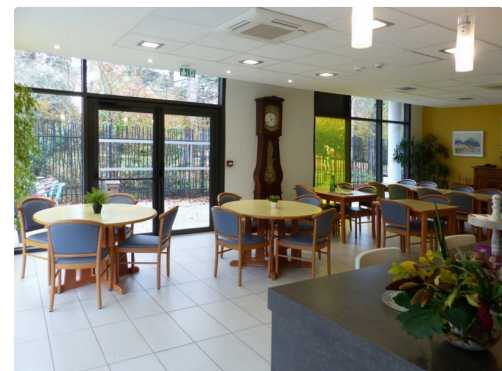
Salle à manger dans la Maison de familles de Poitiersis.jpg