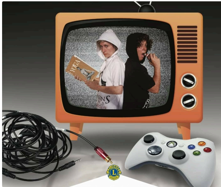
Le Lions Club vous invite à Marciac

Une soirée café-théâtre au profit du bien-être des enfants.