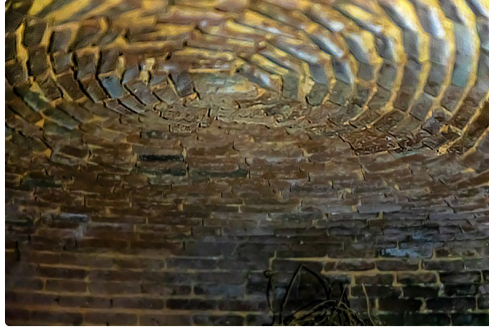
...son plafond en cercles concentriques