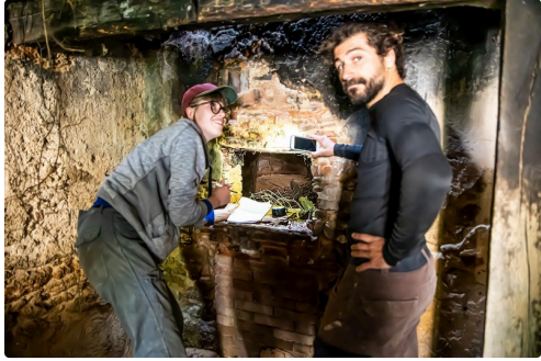
L'ouverture du four où l'on aperçoit...