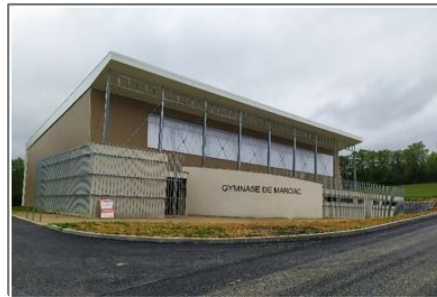
Un budget équilibré un endettement mesuré