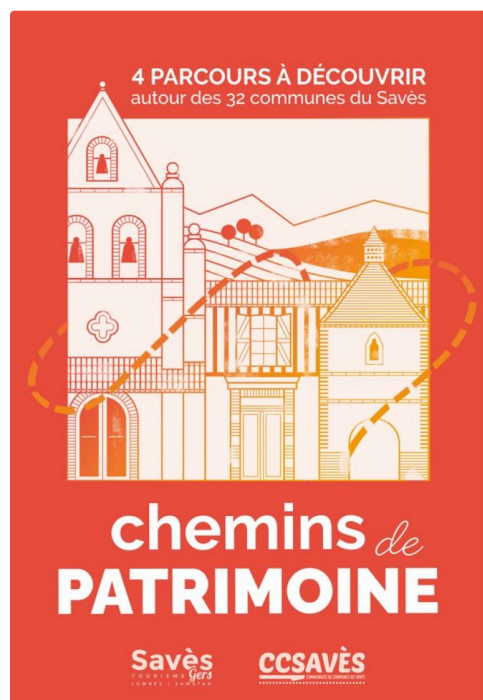
Chemins de patrimoine à Samatan.JPG