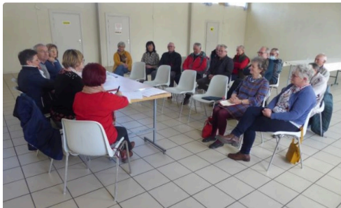
.Assemblée Générale du Cyclo-Club Saint Clairs.