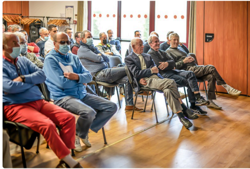
Vue de la salle de réunion le 26 mars