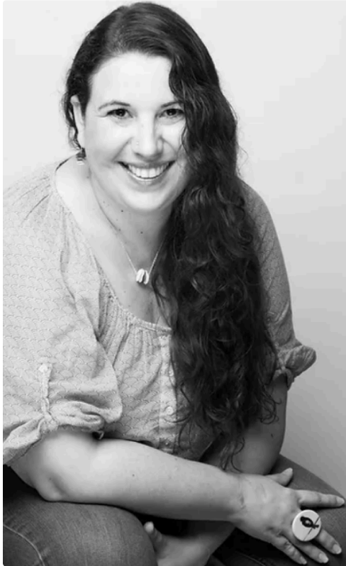
Screenshot 2022-04-02 at 15-01-25 Talavera015.jpg (Image WEBP 570 x 630 pixels).png