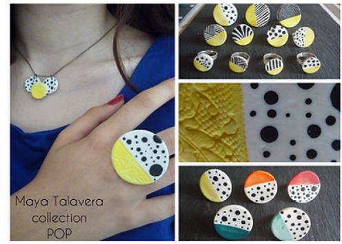
Screenshot 2022-04-02 at 13-03-41 BIJOUX mayatalavera.png