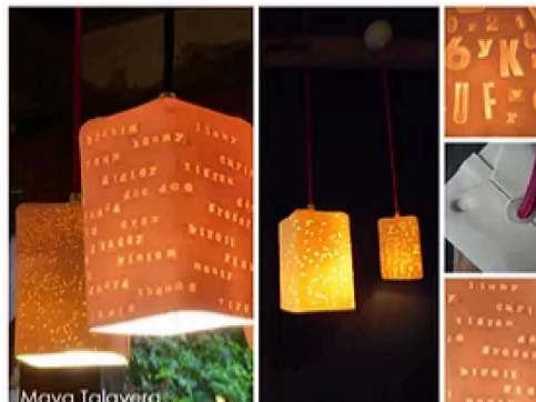
Screenshot 2022-04-02 at 13-05-23 DECORATION mayatalavera.png