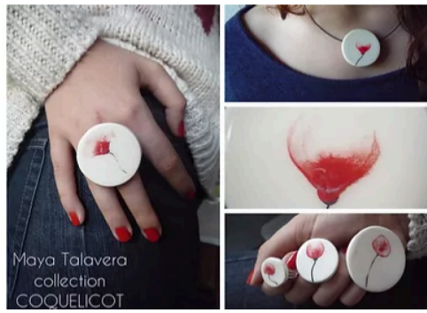
Screenshot 2022-04-02 at 13-04-10 BIJOUX mayatalavera.png