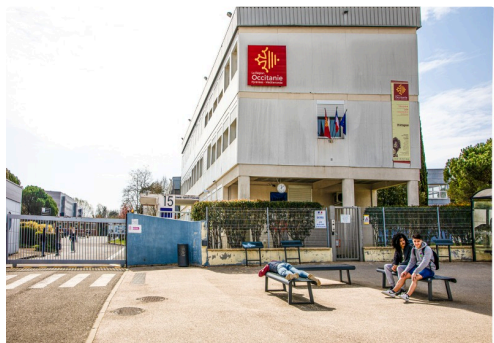
L'entrée de la cité scolaire d'Artagnan