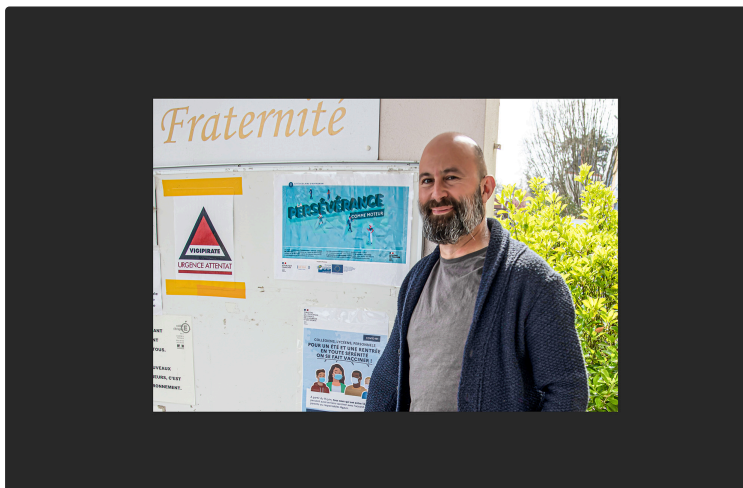
Rattraper les élèves décrocheurs du lycée de Nogaro (mis à jour le 07.04.2022)

Les reconforter, les aider à se diriger et à décider : depuis 5 ans déjà