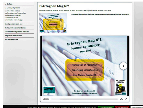
Écran du "d'Artagnan Mag"