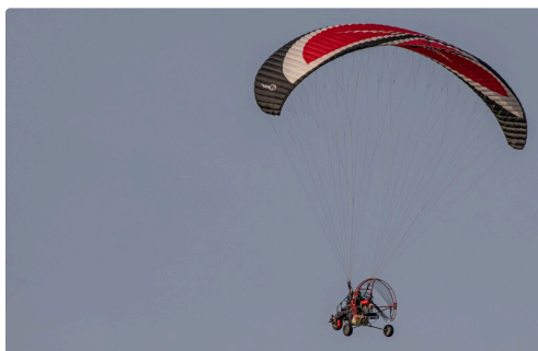
S'agit-il d'un ULM ?