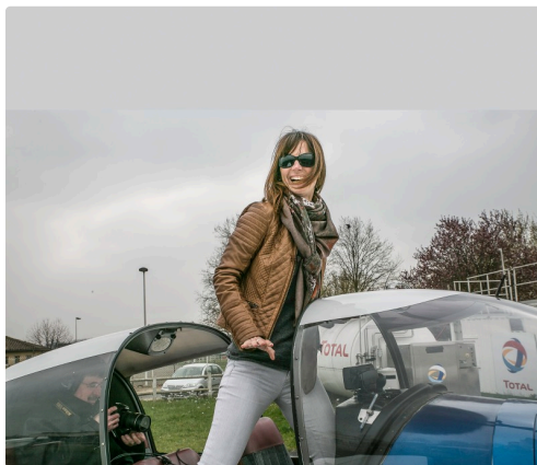
Une journée "ça plane pour elles!" qui fait des heureuses