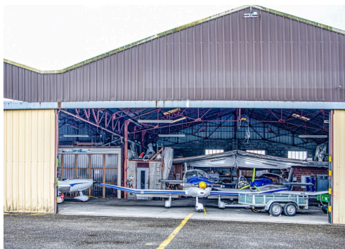
Autre hangar de l'aéro-club