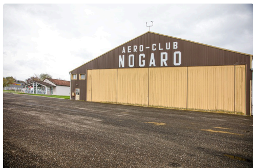
Bâtiment d'accueil (à gauche) et hangar de l'aéro-club

Sur la photo du haut de page: André Malibos.