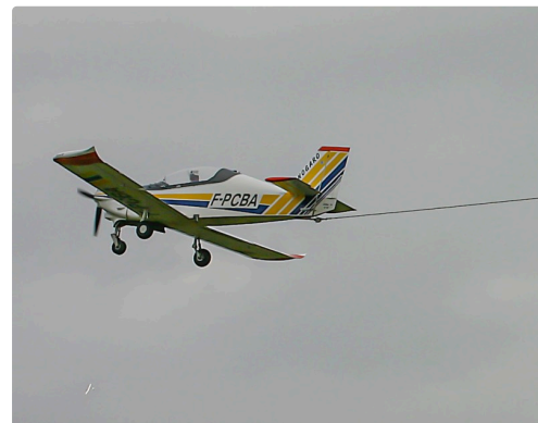
Avion tractant un planeur