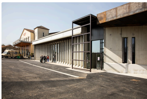
Façade du nouveau chai expérimental