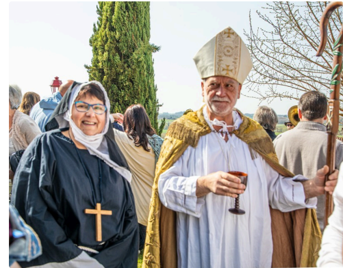
Un "évêque" et une "religieuse" n'ont pas manqué la fête