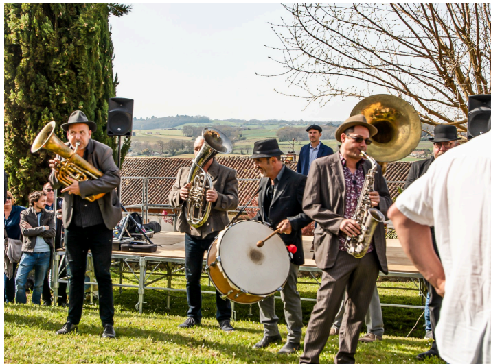
Le groupe Taraf Goulamas

À 11 heures, la foule afflue sur le terre-plein situé en contrebas de l'église de Saint-Mont où va être mise en perce une cuvée emblématique du vin de Saint Mont.