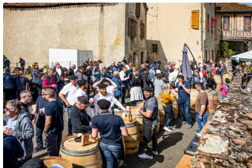
Dégustation dans la rue à Saint-Mont