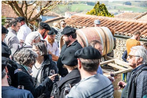
Cohue près de la barrique