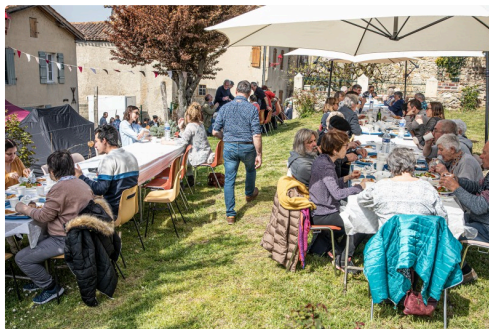
Déjeuner aux tisons dans Saint-Mont