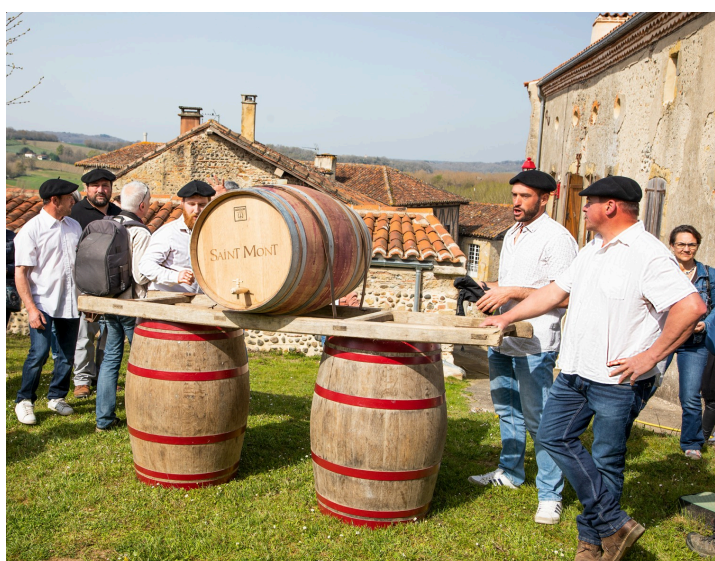
La mise en perce est prête

À 11 heures, la foule afflue sur le terre-plein situé en contrebas de l'église de Saint-Mont où va être mise en perce une cuvée emblématique du vin de Saint Mont.