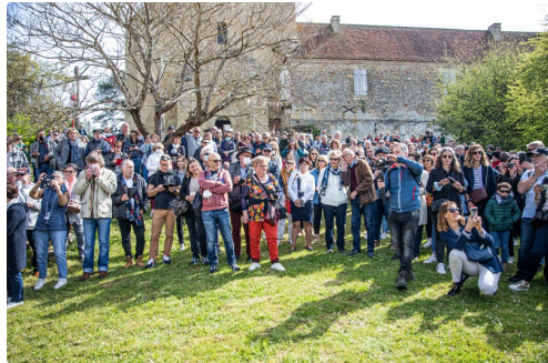
4 Les spectateurs 1bs 260322_.jpg

Bref : une belle journée dans un grand beau temps annonciateur du printemps.