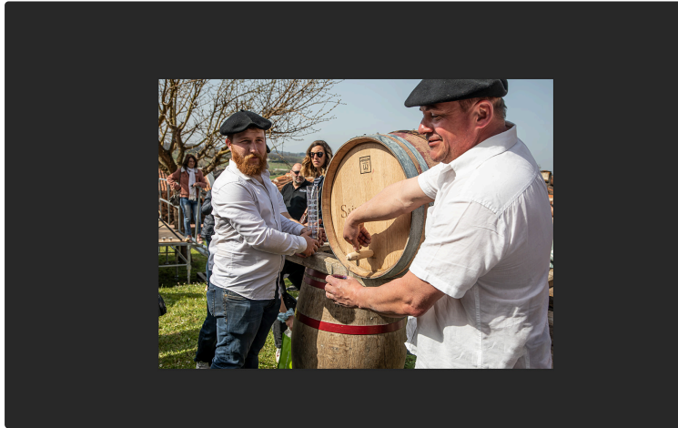
Ouverture de «Vignoble en fête» et mise en perce à Saint-Mont

Les festivités du Vignoble en fête organisées par Plaimont Producteurs dans les villages producteurs de l'appellation Saint Mont ont répondu aux attentes de la nombreuse foule en liesse qui s'est retrouvée dans la joie et la bonne humeur par un grand soleil.