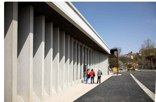
Façade du nouveau chai expérimental