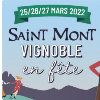
La Villa Saint-Mont en fête à Marciaç.

Bar à vins et boutique éphémère au 9 rue Henri Laignoux