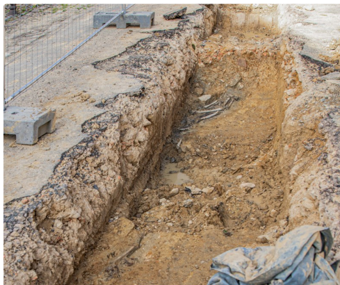
Site de la tranchée rue Saint-Saturnin