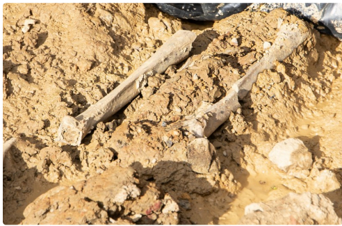
Ossements rue Saint-Saturnin à Aignan