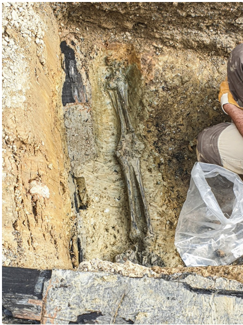
L'archéologue au travail