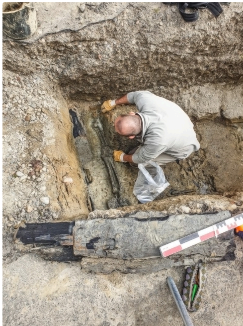
L'archéologue examine la sépulture