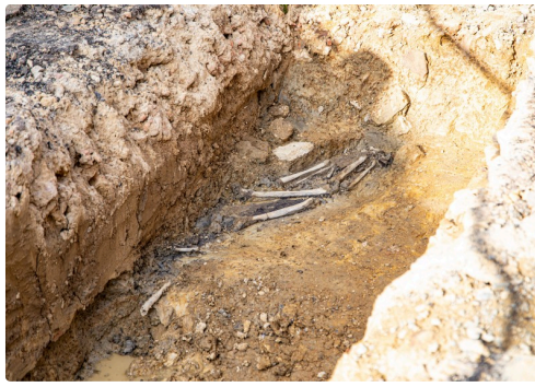
Ossements au fond de la tranchée rue Saint-Saturnin à Aignan