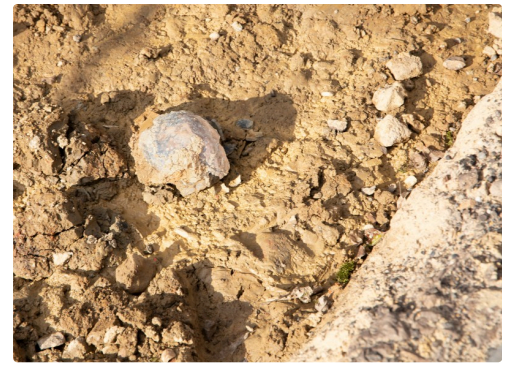
Crâne rue Saint-Saturnin à Aignan