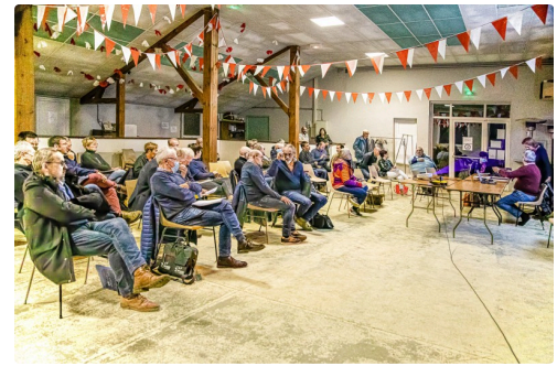
La salle pendant la réunion