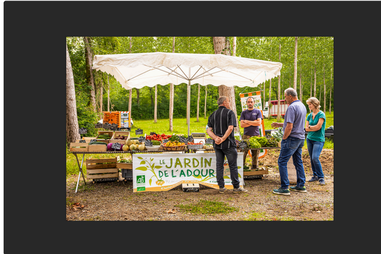
Portes ouvertes demain samedi 19 mars au jardin de l'Adour à Cahuzac-sur-Adour

Début d'une synergie avec d'autres producteurs locaux