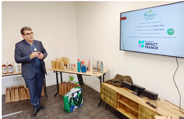
Phytogers révolutionne les produits d'entretien

L'innovation réside sur la mise au point d'ultra concentrés végétaux pour l'entretien