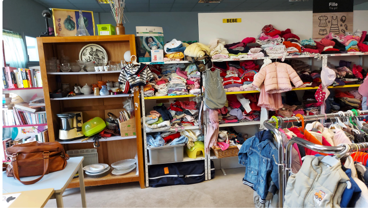
Une nouvelle vie pour les vêtements et les objets à Vetisol !