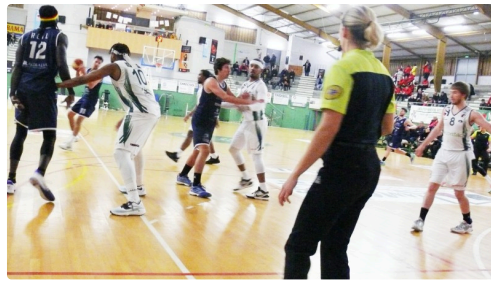
Les défenses n'ont rien lâché.