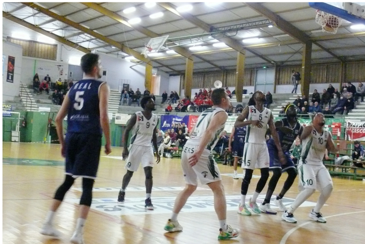
Le rush final du VCGB

Après un mano à mano intense entre les deux formations, Valence-Condom s'impose grâce à sa défense dans les trois dernières minutes de jeu