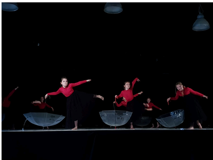
Les élèves de jazz 1