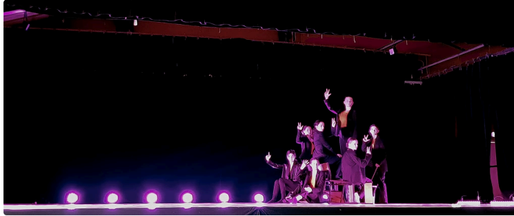
Retour sur les planches réussi pour les élèves de Vic Danse !