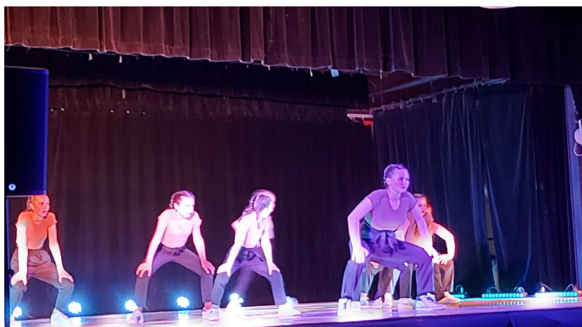
Street jazz enfants ados