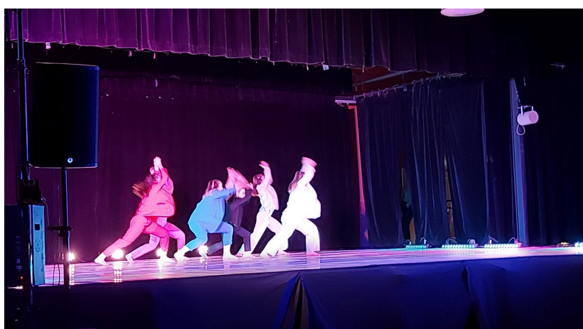
Les élèves de jazz 3

Quant au street jazz, nous avons pu voir danser sur scène le groupe enfants-ados - 8 à 14 ans - et le groupe ados-adultes - 14 ans et plus.