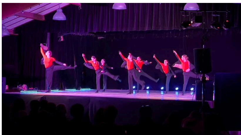
Les élèves de jazz 2