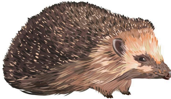
Le hérisson et la belette