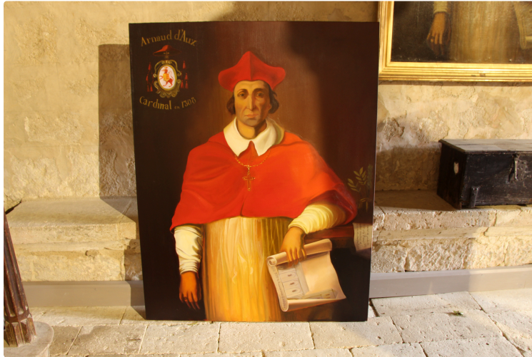
Aïe, deux Aux!

Rassurez vous ce n'est pas un cours d'orthographe ou de grammaire sur l'accord du pluriel. Même si, en l'occurrence on pourrait jouer sur les deux tableaux !