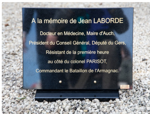
Plaque dans le jardin du souvenir