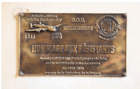
Plaque britannique du SOE sur l'église de Saint-Gô