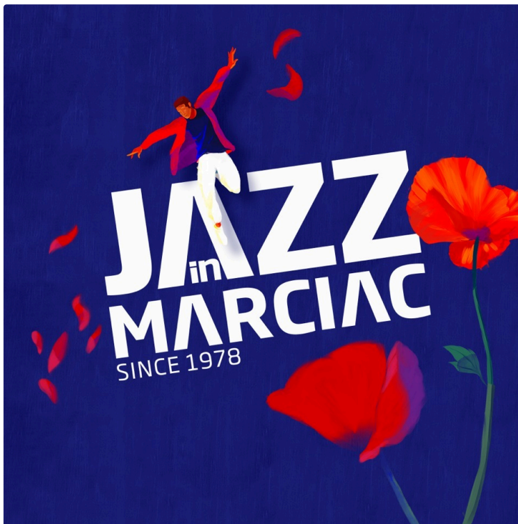
Jazz in Marciac