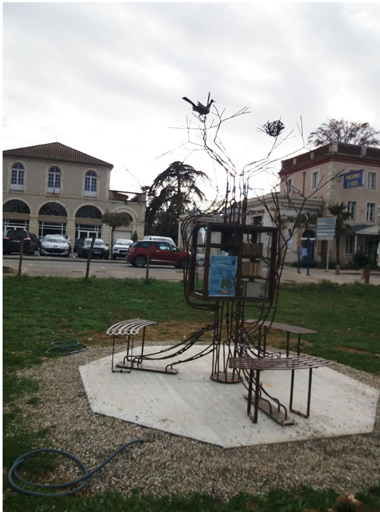
Un arbre à livres monument remarquable

Dans le cadre du budget participatif plusieurs projets ont été retenus, dont l'arbre à livres