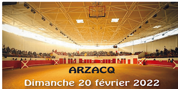
Ouverture de la temporada à Arzacq

C'est à Arzacq ( Béarn) que les aficionados vont retrouver leur premier paseo et voir défiler sur le sable les jeunes toreros de la novillada non piquée organisée dans les arènes couvertes du "Soubestre".