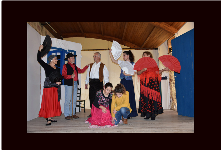
Termes-d'Armagnac : l'Académie médiévale joue « La Savetière prodigieuse » de Garcia Lorca

Une pièce aux allures de farce mais beaucoup plus profonde