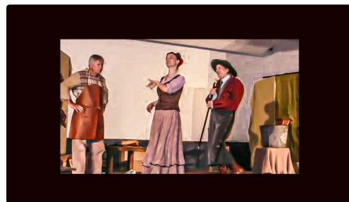
en 2013 Troupe l'Agora de Perpignan à Anglès 1bis.jpg

Federico Garcia Lorca (photo musimem.com)