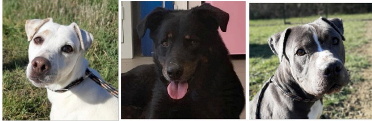
Les trois nouveaux pensionnaires de la SPA

Les trois toutous que nous vous présentons cette semaine ont en commun d'être de nouveaux pensionnaires : ils sont tous les trois arrivés en janvier 2022 à la SPA et, même s'ils y sont bien, ils aspirent à trouver très vite une nouvelle famille.