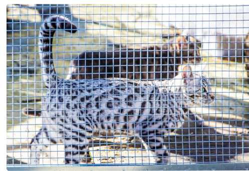
Les deux mères