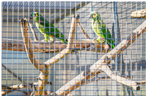
Couple d'Amazones au front bleu