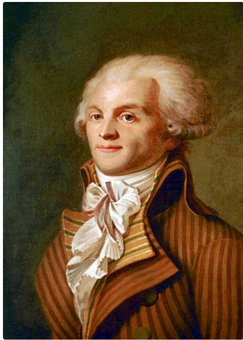
Robespierre (site geo.fr/histoire )