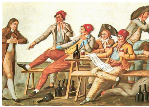
Révolutionnaires sous la Terreur