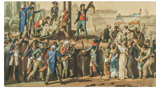
La guillotine (site geo.fr/histoire )