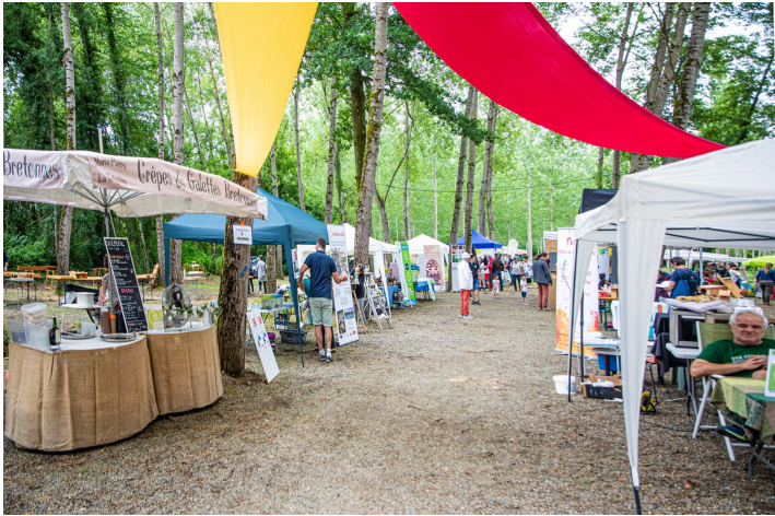
Une allée de l'écofête de 2021