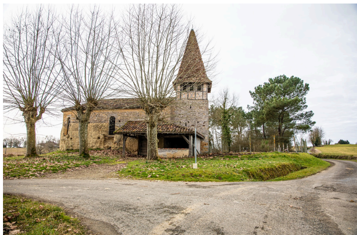
Église de Crémens

Dans ces temps difficiles, nous faisons le maximum pour garder intacts les sentiments, fortifier notre vie de la commune dans tout ce qu'elle comporte de beau pour le vivre ensemble.