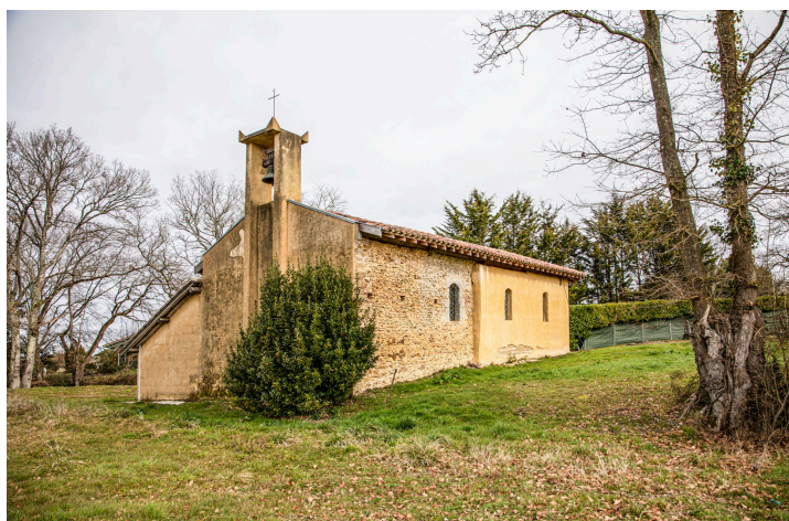
Église Saint-Jean-Baptiste de Daunian

Le fleurissement du village sera aussi amélioré cette année.