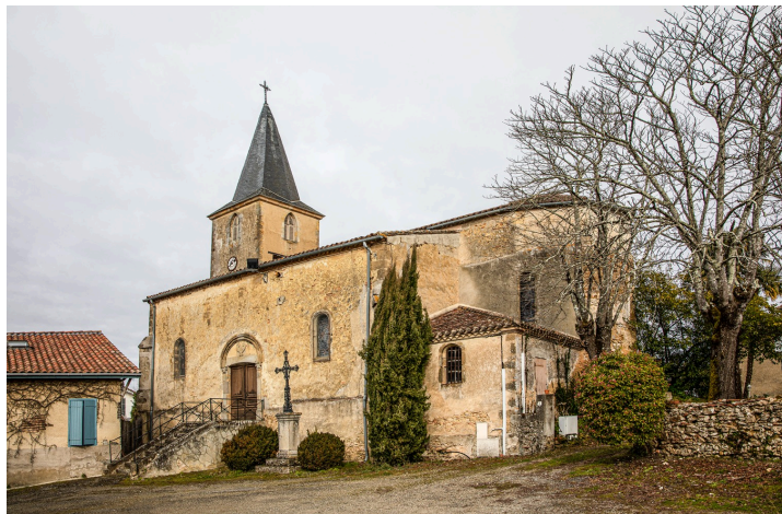
Église de Magnan

Après l'électrification de la chapelle de Daunian, celle de Crémens aura, elle aussi, un éclairage de son clocher, déjà inscrit au titre du patrimoine.