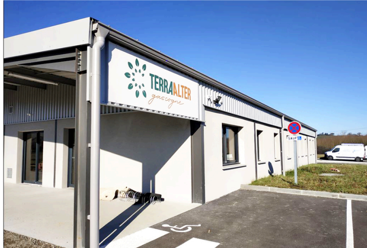
Terra Alter déménagement. Du lac de Marciac à la ZAE de Cagnan.

Une nouvelle étape pour son développement