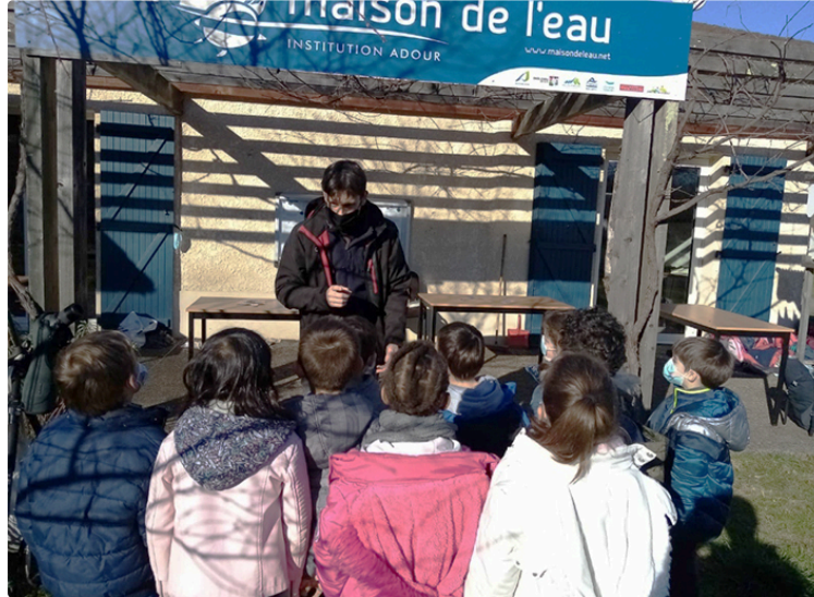
La Maison de l'Eau pour une découverte ludique de la Nature.

Les élèves de l'école primaire ont apprécié