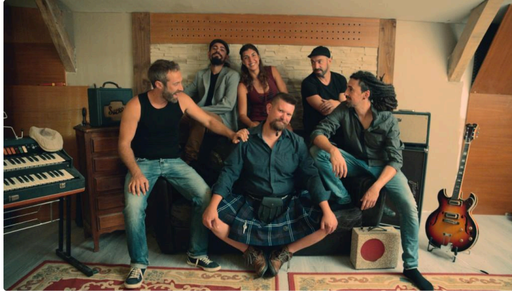
Graines de Sel, un voyage musical dans un monde différent

Nous vous avons parlé du groupe Graines de Sel à l'occasion de la sortie de leur clip « Propaganda » tourné dans les arènes de Vic-Fezensac.