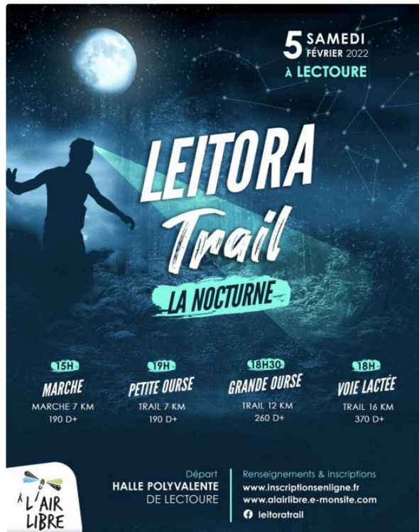
Leitora Trail Un trail nocturne à Lectoure!

L'association "A l'air libre" organise un trail nocturne le samedi 5 février 2022.