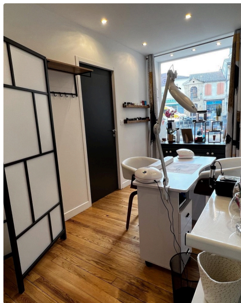
Un espace accueillant.