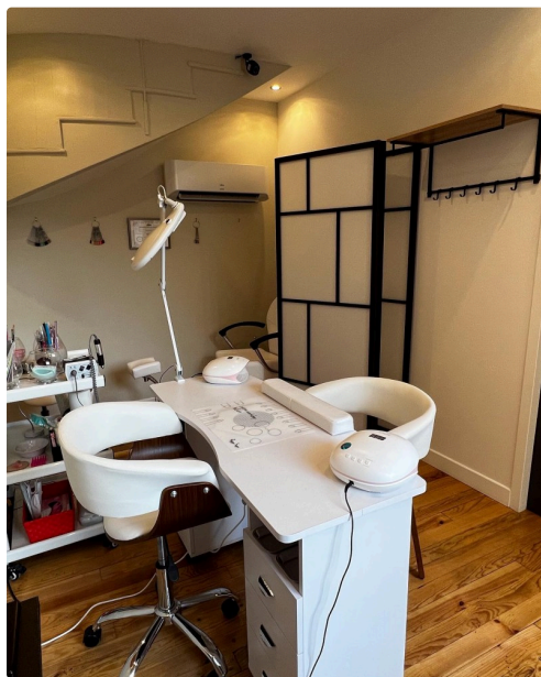
Aperçu de la boutique.