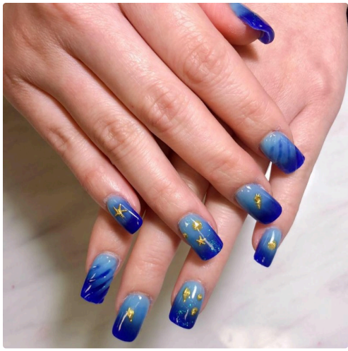
Un décor festif.