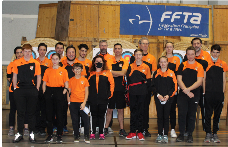
La Flèche Gasconne annonce son prochain concours

Ce week-end aura lieu le prochain concours de la Flèche Gasconne de L'isle-Jourdain, ce sport attire de plus en plus d'adeptes, ce sera l'occasion au public de le découvrir et d'admirer la précision et l'ambiance sympathique qui s'en dégage ... ! Ce concours est sélectif pour les Championnats de France. Avec le Concours jeunes et découverte le samedi.